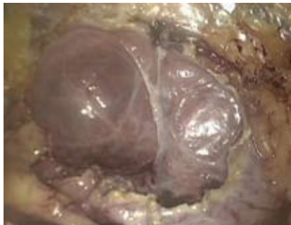
Рисунок 4. Заключительный этап операции

и ушиваются участки проколов (некоторые этапы ретроперитонеоскопического иссечения кист почки показаны на рисунке 1-4).