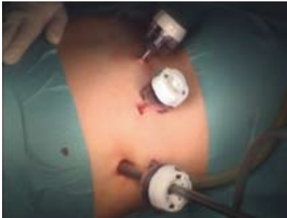
Рисунок 1. Расположение троакаров