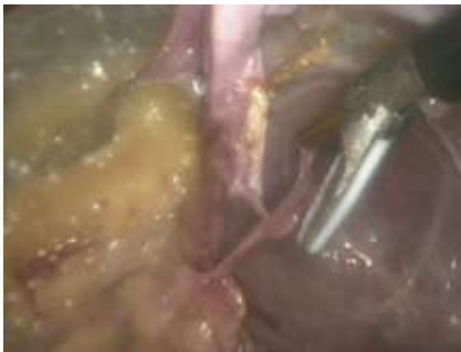
Рисунок 3. Иссечение стенок кисты

шину. Рассекают почечную фасцию и находят латеральную поверхность почки. Сначала мобилизуют ее, а затем полюса почки. На этом этапе рекомендуется установить третий дополнительный троакар по передней подмышечной линии напротив первого, введенного в поясничном треугольнике. Третий троакар нужен, чтобы отводить почку медиально и обеспечить доступ к ее задней поверхности и воротам.