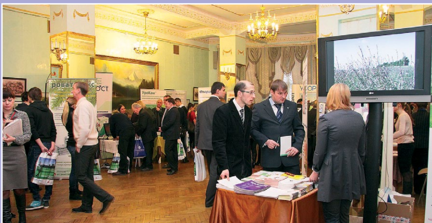
Выставочная экспозиция конференции «Рациональная фармакотерапия в урологии»

сти силодозина, отмечена низкая частота ортостатической гипотензии, отсутствие антагонистического взаимодействия с ингибиторами ФДЭ-5 (силденафилом, тадалафилом), редко отмечалась (3,9%) ретроградная эякуляция. Зафиксирована высокая безопасность препарата.