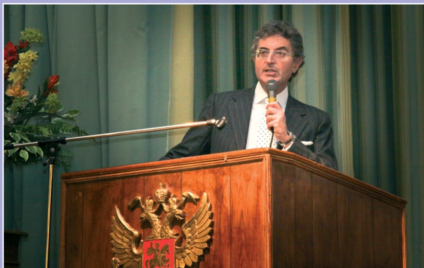
Доклад профессора Франческо Монторси (Италия)

В своих презентациях все докладчики отметили рост резистентности к антибиотикам у ведущих возбудителей мочевой инфекции. Так, по данным последнего российского исследования ДАРМИС, изучавшего динамику антибиотикорезистентности возбудителей внебольничных ИМП в различных субпопуляциях пациентов, показано незначительное снижение роли возбудителя ИМП – E. coli (64,5%), Klebsiella pn. (9,5%), Enterococcus spp. (6,46%), Staphylococcus spp. (5,1%), Proteus mir. (4,08%). Уровень резистентности кишечной палочки, превышающий пороговый уровень (10-20%) для эмпирического назначения, отмечен для ампициллина (37%), ко-тримоксазола (22,6%), налидиксовой кислоты (13,2%) и приближающийся к пороговому значению – для фторхинолонов (9,5%). Для других возбудителей внебольничной мочевой инфекции уровень резистентности находится выше пороговых уровней и составляет от 12