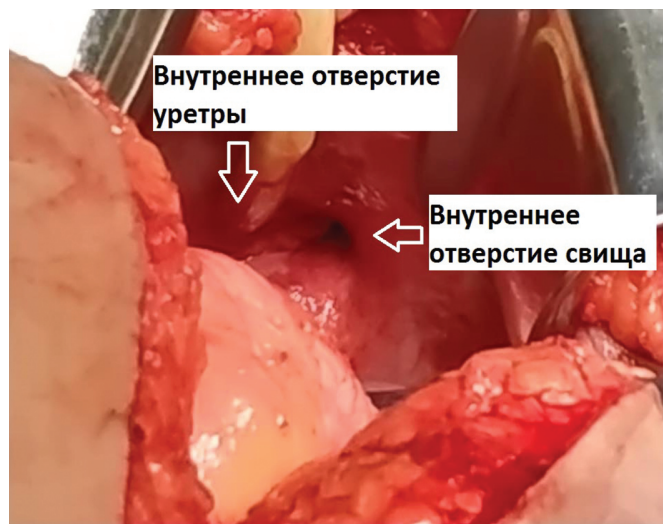
Рис. 7. Больная А. Интраоперационное фото. Внутреннее отверстие свища до 7 мм, воронкообразно сужающееся до нескольких миллиметров, расположенное в области передней стенки мочевого пузыря позади симфиза, справа и над внутренним отверстием уретры

17.05.2019 г. больной выполнена операция – трансвезикальная фистулопластика. Осуществлен внебрюшинный доступ к мочевому пузырю. Выделены передняя и боковые стенки мочевого пузыря. Проведена продольная цистотомия в области передней стенки мочевого пузыря. При ревизии мочевого пузыря обнаружено внутреннее отверстие свища до 7 мм, воронкообразно сужающееся до нескольких миллиметров, расположенное в области передней стенки мочевого пузыря позади симфиза справа и над внутренним отверстием уретры. Расстояние от внутреннего отверстия уретры до свища около 1,5 см (рис. 7,8). Передняя стенка мочевого пузыря в области свища плотно фиксирована к задней поверхности