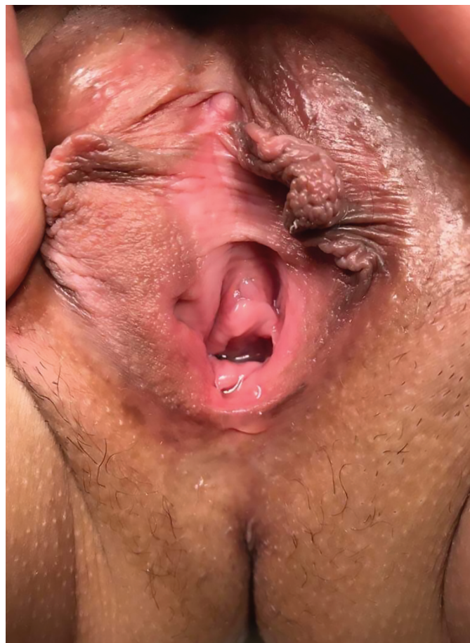
Рис. 1. Больная А. Наружные половые органы пациентки. Наружное свищевое отверстие у основания правой малой половой губы Fig. 1. Patient A. External genital organs of the patient. External fistulous opening at the base of the right labia minor

В январе 2017 г. у больной была политравма в результате автоаварии: множественные переломы ребер, грудины, ушиб легких, посттравматическое расслоение интимы нисходящего отдела аорты с образованием аневризмы, ушиб сердца, разрыв печени, ушиб мочевого пузыря, закрытый оскольчатый перелом лонной кости справа со смещением, разрыв лонного сочленения. Госпитализирована в стационар по месту жительства. 13.01.2017 г. выполнено дренирование правой