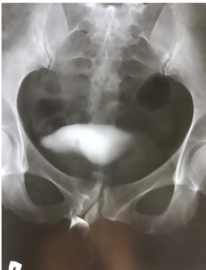
Рис. 2. Больная А. Фистулограмма в прямой проекции Fig. 2. Patient A. Fistulogram in frontal projection

Пациентке выполнена фистулография в прямой проекции (рис. 2), компьютерная томограмма таза (рис. 3) и КТ-фистулография с 3-D реконструкцией