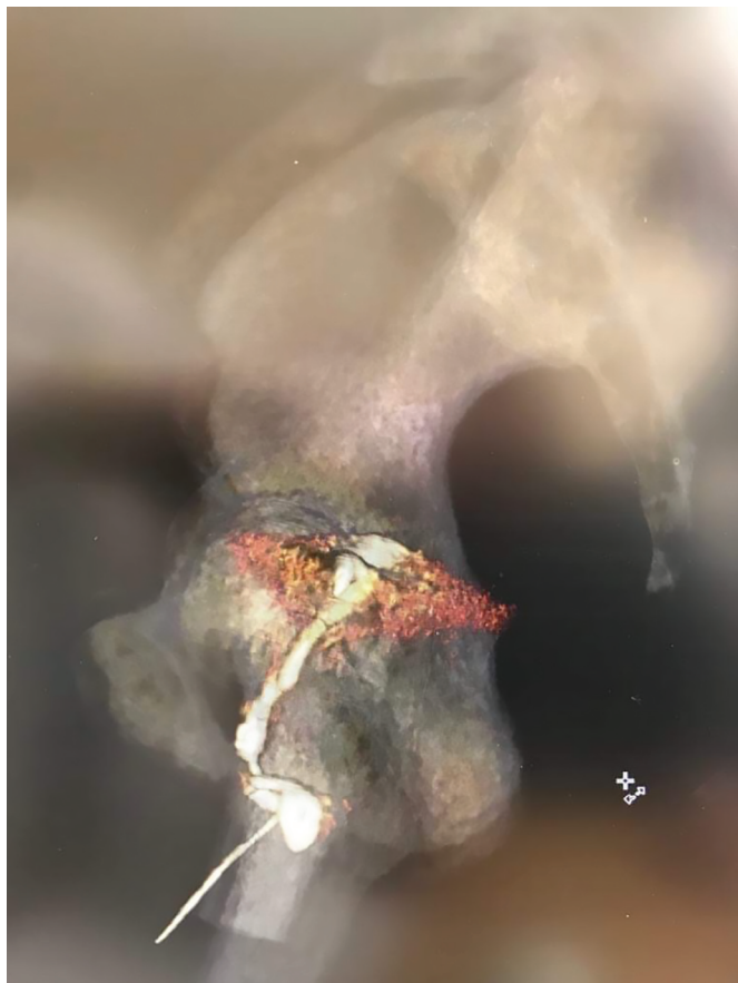
Рис. 6. Больная А. КТ-фистулография с 3-D реконструкцией Fig. 6. Patient A. CT fistulography with 3-D reconstruction

Таким образом, на основании комплексного предоперационного обследования у пациентки диагностирован пузырно-вulварный свищ.