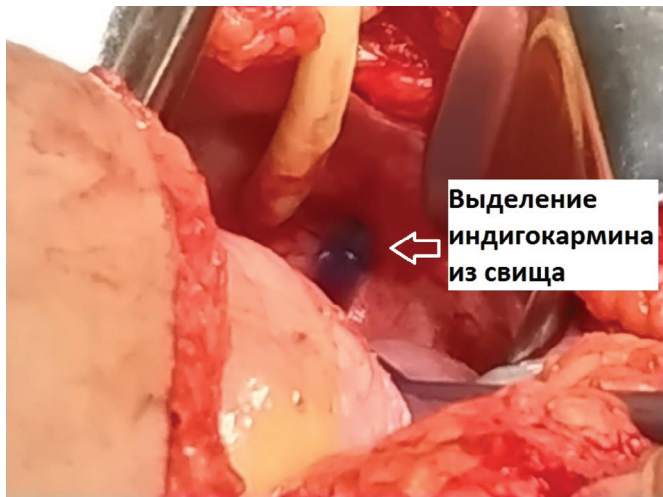
Рис. 8. Больная А. Интраоперационное фото. Выделение индигокармина из внутреннего отверстия свища

Fig. 7. Patient A. Intraoperative photo. The internal opening of the fistula is up to 7 mm, funnel-shaped tapering to several millimeters, located in the region of the anterior wall of the bladder behind the symphysis, on the right and above the internal opening of the urethra