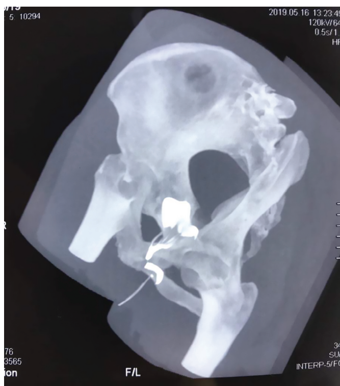
Рис. 4. Больная А. КТ-фистулография с 3-D реконструкцией Fig. 4. Patient A. CT fistulography with 3-D reconstruction