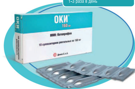
Схема приема Взрослым: 1 суппозиторий 1-3 раза в день