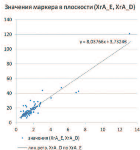
Рис. 1. Линейная зависимость значений ХгА (ДАКО и Euro-Diagnostica)

Для нашего исследования более важным, чем установление наличия зависимости, является описание закона этой зависимости. Визуальный анализ рисунка 1 позволяет выдвинуть предположение о том, что связь значений измерений маркеров, как для контрольной группы, так и в остальных случаях можно описать как линейную.