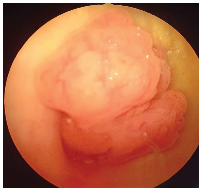
Рис. 1. Большой X. Фиброэпителиальный полип мочеточника, пролабирующий в полость мочевого пузыря.

В первом наблюдении, у мужчины, 72 лет, спустя 10 мес после трансуретральной резекции (ТУР) опухоли мочевого пузыря выявлен папиллярный рак щитовидной железы, произведена резекция органа. Во втором случае, у мужчины, 74 лет, была выполнена резекция опухоли сигмовидной кишки, а спустя 3 года диагностирована уротелиальная карцинома мочевого пузыря, также выполнена ТУР. Оба пациента получали внутривезикулярную БЦЖ терапию. Динамическое наблюдение после ТУР опухоли мочевого пузыря и БЦЖ-терапии проводилось в течение первого года ежеквартально, со второго года – каждые 6 мес. При очередном ультразвуковом исследовании (УЗИ) и МРТ-скрининге органов малого таза у пациентов были диагностированы образования в мочевыводящих путях. В первом случае через 2 года после резекции уротелиальной карциномы выявлена опухоль около 4 см в нижней трети правого мочеточника, пролабирующая через устье в мочевой пузырь (рис. 1). У второго пациента спустя 2,5 года после ТУР определено подозрение на наличие рецидива новообразования в области устья мочеточника. Во время уретероскопии визуализированы полиповидные образования, свободно выходящие из мочеточника в полость мочевого пузыря. ■